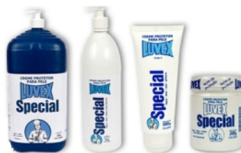
Linha Specioal LUVEX