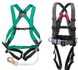
Cinto Segurança / Paraquedista