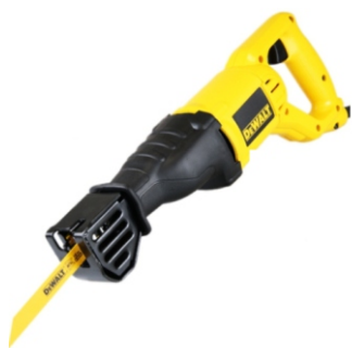
Serra Corte Sabre