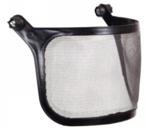
Tela para Protetor Facial