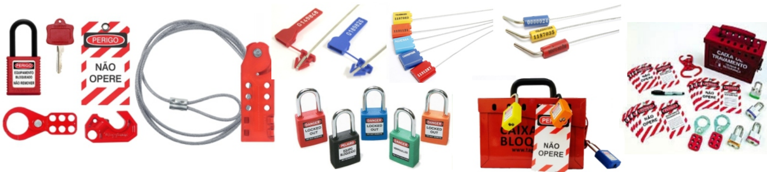
Garras e Travas