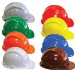
Capacetes em geral (abafadores de ruído, proteção facial)