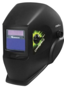
Máscara de Solda Automática