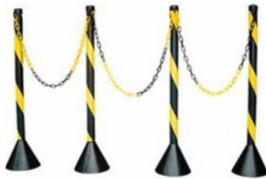
Pedestais - Finalizações