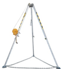
Tripé Espaço Confinado