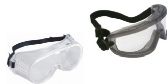
Óculos de Ampla Visão