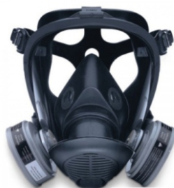
Protetor Facial Inteira