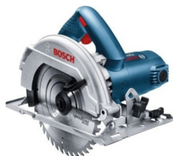
Serras de Corte