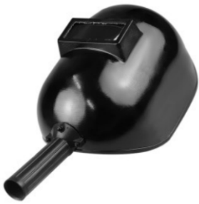
Máscara de Solda