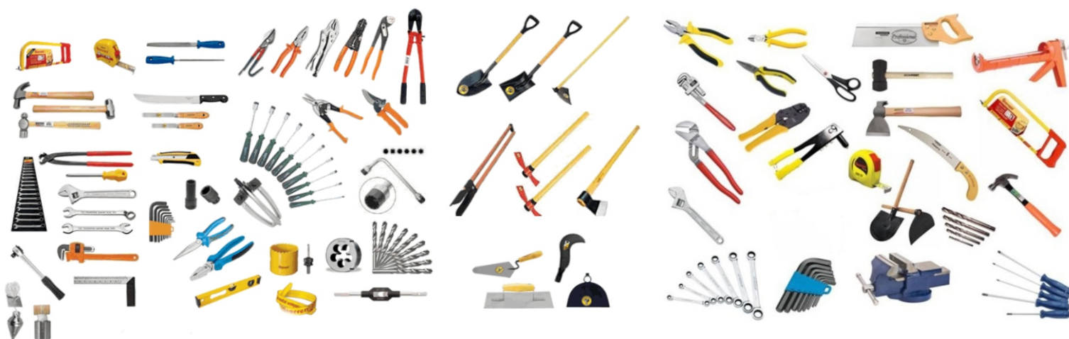
Ferramentas para Serviços Gerais