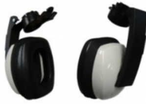
Abafador Concha Acoplar