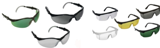
Óculos de Segurança Variados